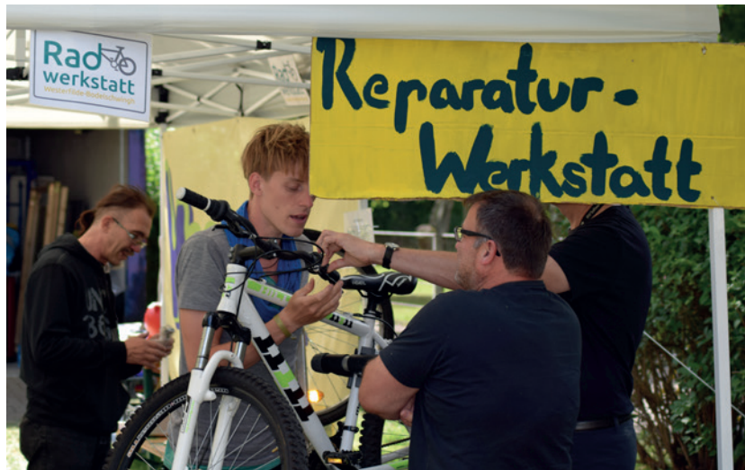
Rad-Werkstatt in Dortmund Westerfilde

Bringt man diese hier zusammengefassten Methoden bzw. Vorgehensweisen zur Erzielung gesellschaftlicher Wirkungen mit den vorher beschriebenen wahrgenommenen Wirkungen in Zusammenhang, können Verbindungen zwischen diesen aufgezeigt werden: wie zum Beispiel, dass die Fahrradwerkstatt Wirkungen in den Bereichen Verhaltensänderungen (Mobilitätsverhalten), physischen Veränderungen (Werkstatt vor Ort) sowie Empowerment (durch Selbstwirksamkeitserfahrung) aufzeigt und Letzteres wiederum einen Einfluss auf die Lebensqualität hat.