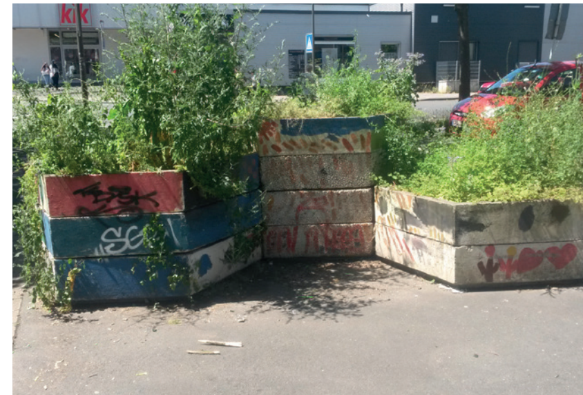
Westfilderser Marktplatz vor der Mal- und Pflanzaktion

Die Lebensqualität hat sich, laut den Befragten und wie auch die Bevölkerungsbefragung zeigt, zum einen in der Hinsicht verbessert, dass die Menschen zufriedener sind mit dem Stadtteil, in dem sie leben. Dies kommt laut einem Interviewten u.a. dadurch, dass wahrgenommen wird, wie sich andere mit dem Stadtteil auseinandersetzen und etwas für ihn und seine Bewohner*innen tun.