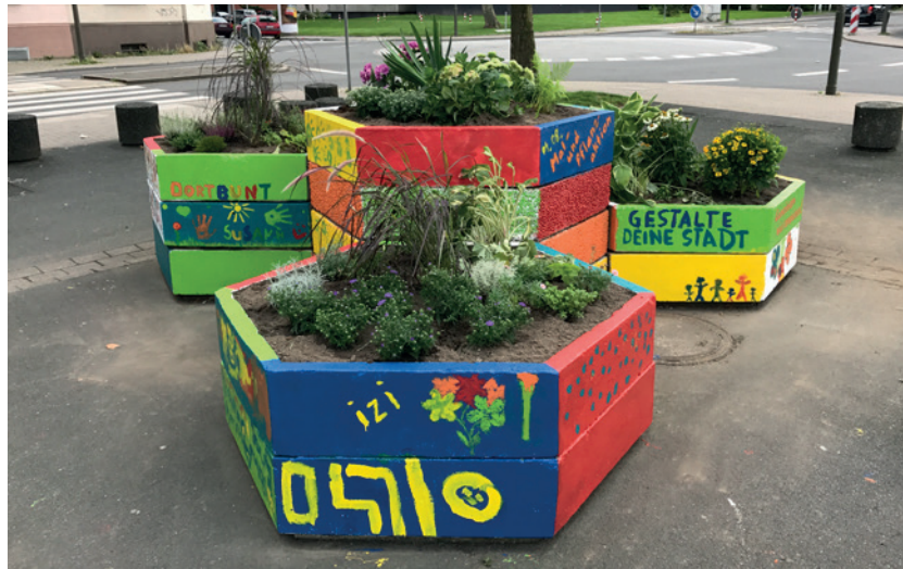
Westerfelder Marktplatz nach der Mal- und Pflanzaktion

Die ausgedehnte Ankommensphase war zentral für ein besseres Verständnis des Quartiers sowie seiner Bewohner*innen. Dadurch war es den Projektbeteiligten möglich, spezifische Problemlagen und Bedürfnisse vor Ort zu erkennen und in die Projektkonzeption einfließen zu lassen. Zudem konnte so die für die weiteren Aktivitäten notwendige Vertrauensbasis aufgebaut werden. Diese Anbindung an die Lebenswelt vor Ort und die Vertrauensbasis waren von großer Wichtigkeit, da es sich um einen Stadtteil mit besonderem Entwicklungsbedarf handelt, in dem die Bewohner*innen in ihren Leben oftmals mit mehreren anderen Problemen beschäftigt sind.