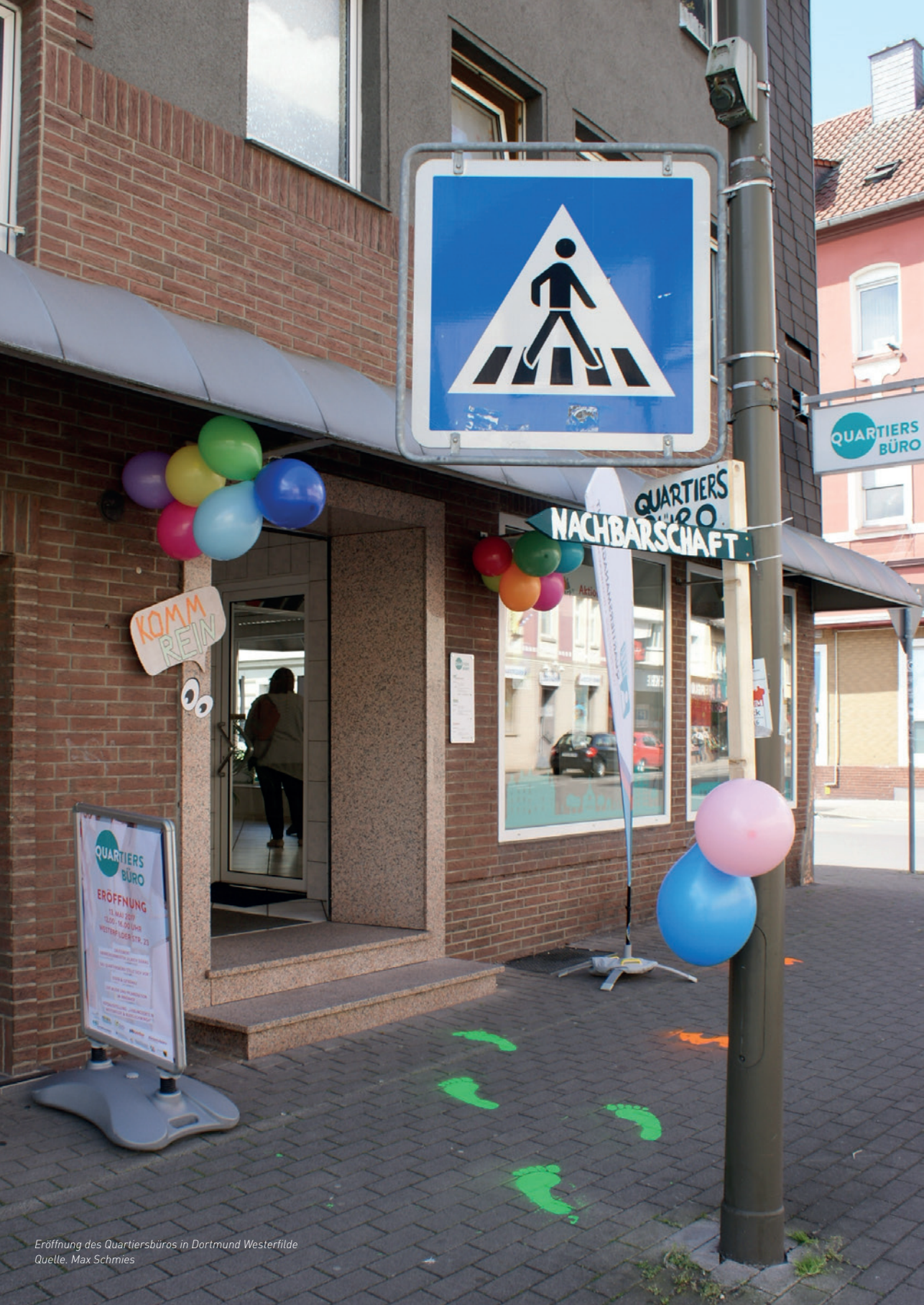
Eröffnung des Quartiersbüros in Dortmund Westertilde