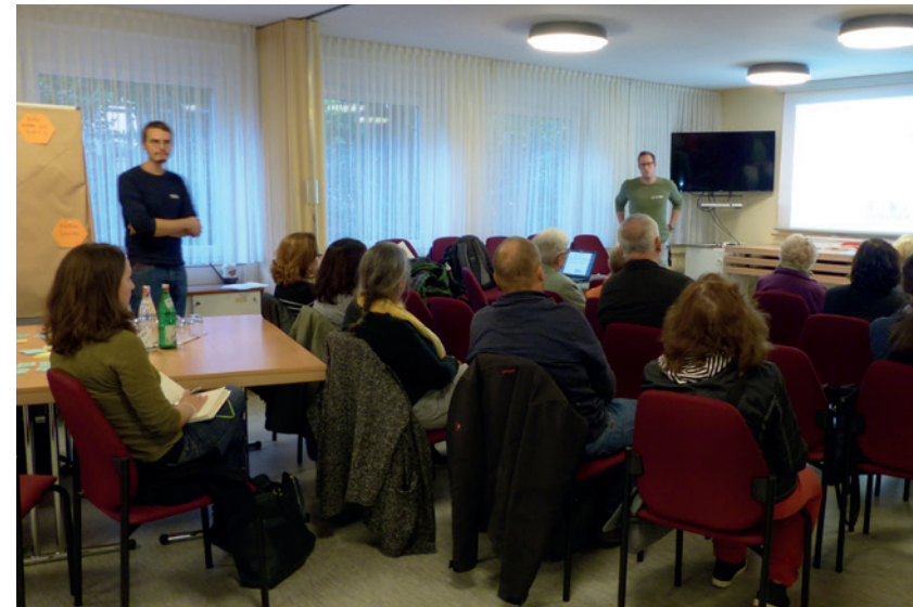
Quartiers-Werkstatt mit Bürger*innen aus Dortmund-Westerfild

Ein Ansatzpunkt für den Transformationsprozess war die Vernetzung relevanter Akteur*innen untereinander und mit Bürger*innen sowie das Anregen von Austausch und Kommunikation zwischen diesen. Dabei wurde auf den bereits durch