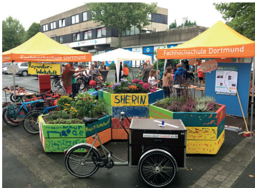
Fahrradnachmittag mit Flohmarkt und Selbsthilfe-Werkstatt

Ausgewählt wurde dieser Untersuchungsort, da in ihm verschiedene sozial-räumliche Herausforderungen zusammentreffen, welche Bürger*innenbeteiligung hemmen können. Dabei sollte es durch partizipative Maßnahmen gemeinsam mit lokalen Akteur*innen zum Zusammenspiel von Beteiligungsmöglichkeiten und Empowerment-Prozessen in der Bevölkerung kommen. Ziel war es dabei, Handlungsempfehlungen für Akteur*innen in Kommunen, Politik und Zivilgesellschaft zur Förderung einer nachhaltigen Transformation in Großstädten zu formulieren.