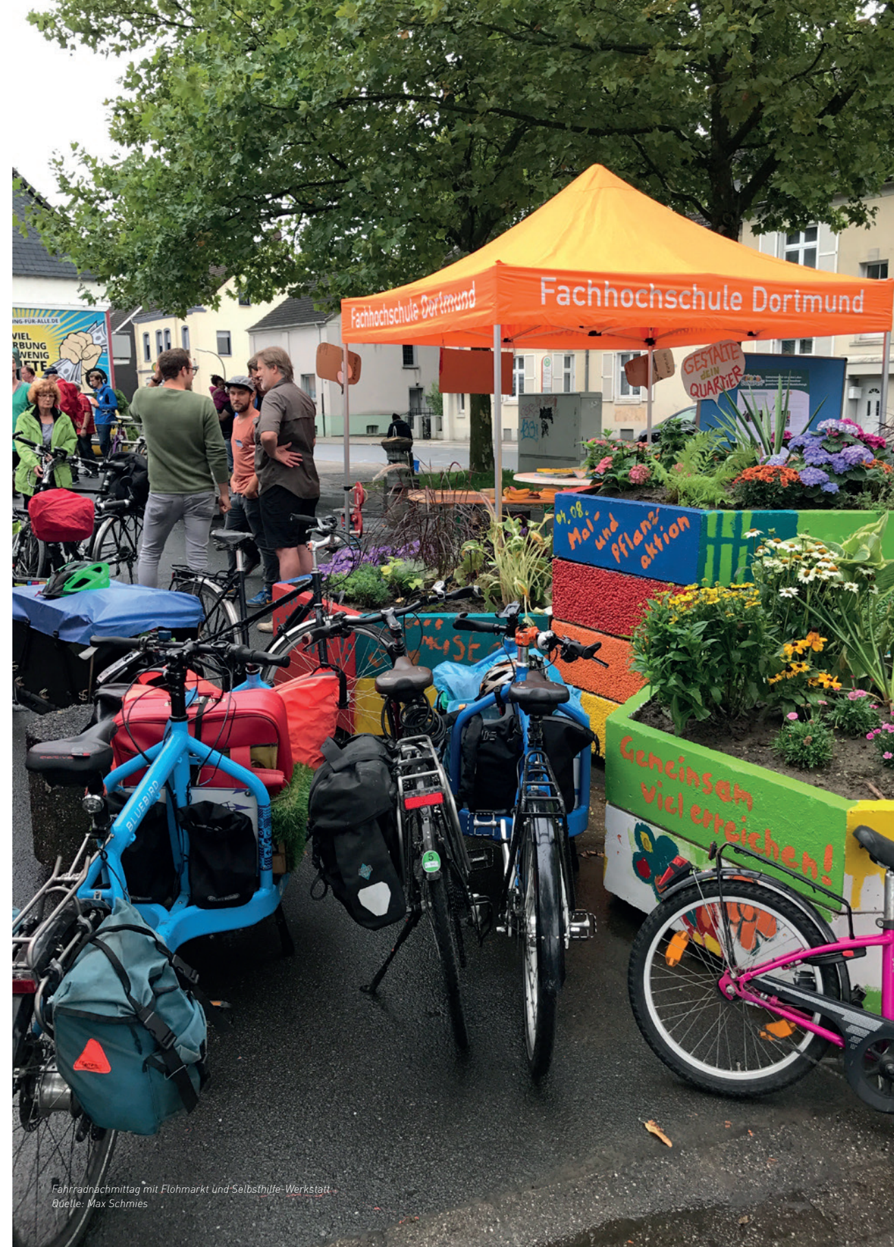
Fahrradnachmittag mit Flohmarkt und Selbsthilfe-Werkstatt.

Letztlich wurde Transformation über das Projekt hinaus auch dadurch angeregt, dass die Projektbeteiligten ihre Sensibilität für Partizipation und Nachhaltigkeit mit in neue Praxisprojekte tragen. Dabei wurden einzelne Grundgedanken und Ansätze zur Beteiligung auch in andere Stadtteile Dortmunds übertragen und von anderen Projekten und Institutionen aufgegriffen.